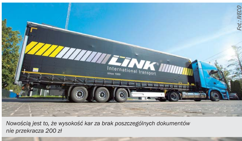
Nowością jest to, że wysokość kar za brak poszczególnych dokumentów nie przekracza 200 zł

ność zachowania limitu 9-10 godz. jazdy w dziennym rozkładzie. Przekroczenie tej normy do jednej godziny skutkuje karą 50 zł za jazdę dzienną. Każda kolejna godzina to dodatkowe 100 zł. Tu również dostrzegamy obniżkę kary, ponieważ „stary taryfikator” rozpoczynał się od 100 zł – 50% obniżka za pierwszą godzinę ponadprogramowej jazdy z pewnością wzbudzi-