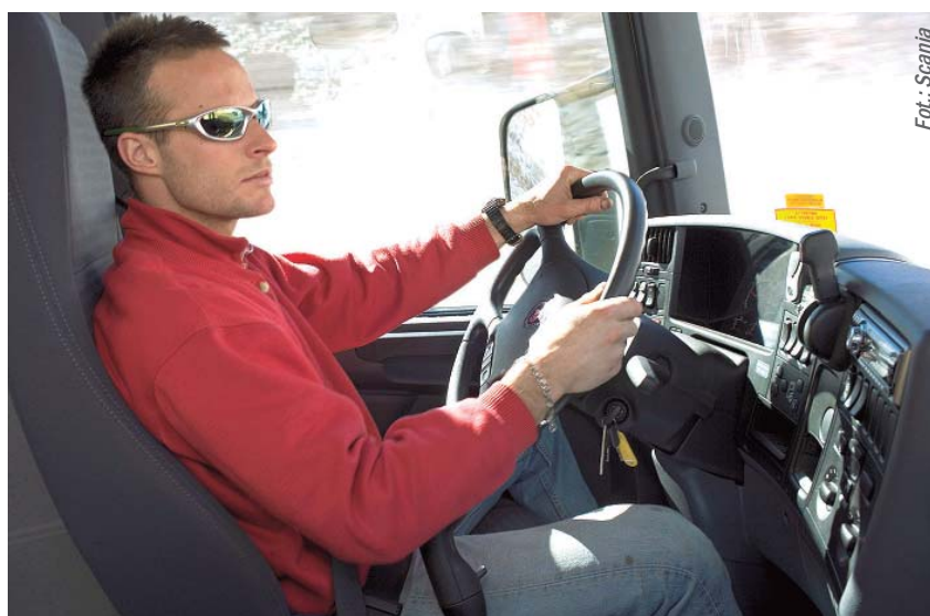
Zgodnie z lp. 3 kierujący okazując prawo jazdy bez wymaganego kodu 95 (czyli posiadanej kwalifikacji wstępnej lub posiadanej ukończonego szkolenia okresowego, dawnego kursu na przewóz rzeczy lub osób), naraża się na karę w wysokości 150 zł

Oczywiście, wszystko zależy od osobistych umiejętności wyjaśnienia zaistniałej